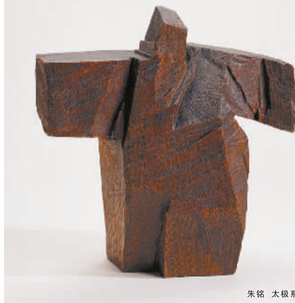
朱铭 太极系列·十字手